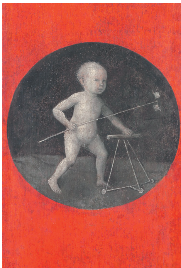
Рис. 1. Иероним Босх (1450?–1516). Младенец Иисус (1510)

С 1 ноября 1992 г. по 31 января 1993 г. проведен опрос родителей 207 детей в возрасте 3–24 мес.