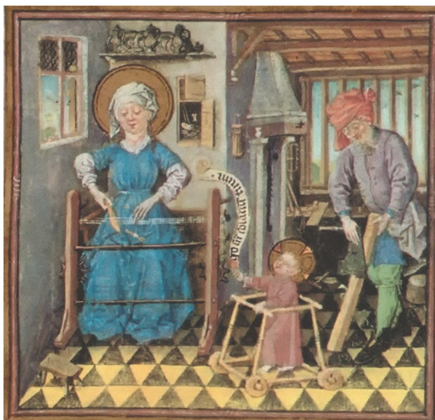
Рис. 2. Иллюстрация голландского художника Мастера Клеве (1440 г.р.), из книги «Часы Екатерины Клеве». Святое семейство за работой

(г. Дения, Испания) для оценки социально-экономических особенностей семей и определения закономерностей использования ходунков [3]. Авторы обнаружили, что 42% родителей детей в возрасте от 4,3 до 13,4 мес. использовали подобные устройства, 46,7% из них – ежедневно. Выявлена статистически значимая обратная корреляция ( r > -0,6 ) между частотой использования ходунков и уровнем образования матери. Предполагаемые преимущества применения ходунков, о которых сообщали родители: 34,2% – комфорт для родителей; 10,9% – развлечение для малыша; 12,9% – помощь в развитии ребенка. При этом 46,3% родителей не отметили каких-либо преимуществ.